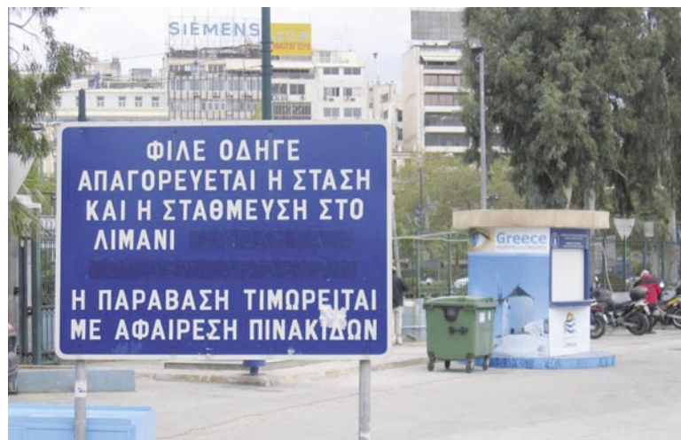
Λιμάνι του Πειραιά, Νοέμβριος 2007: «Φίλε οδηγέ...» Αλήθεια, από πότε γίναμε «φιλοι» κύριοι υπεύθυνοι του ΟΛΠ και δεν το αντιλήφθηκαν; Είναι ενήμερο το Υπουργείο Μεταφορών για τις πινακίδες αυτές ή είναι και αυτοί «φιλοι» μας;