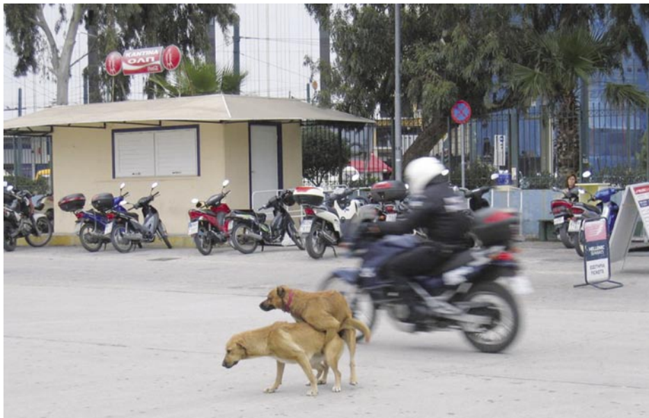
Λιμάνι του Πειραιά, Νοέμβριος 2007: Κλειστή καντίνα εδώ και μήνες, κυκλοφοριακό κομπούζιο με τα σταθμευμένα μηχανάκια παντού, αγώνες δρόμου για τα διερχόμενα μηχανάκια (κι ας είναι το όριο ταχύτητας 20 κλμ/ώρα) και τα σκυλιά να περνάνε πν ώρα τους μέρα-μεσημέρι. Φαντάσου ο Πειραιάς να μην ήταν το πρώτο λιμάνι της χώρας τι θα γινόταν...