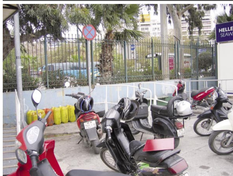
Λιμάνι του Πειραιά, Νοέμβριος 2007: Τα σταθμευμένα μηχανάκια και οι «διακοσμητικές» πινακίδες του Κ.Ο.Κ. «Απαγορεύεται η στάση και στάθμευση».