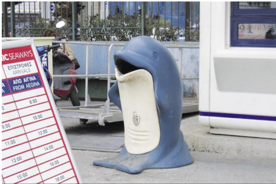
Λιμάνι του Πειραιά, Νοέμβριος 2007: Κάνανε τα δελφίνια σκουπιδοντενεκέδες... Κατά τα άλλα μας μιλάνε για προστασία του θαλάσσιου πλούτου... Ωραία παραδείγματα δίνετε στα παιδιά μας, κύριοι υπεύθυνοι του ΟΛΠ.

πω και να βιώνω καθημερινά τη μικρότητα, τον αντιεπαγγελματισμό, την αδιαφορία και το απολίτιστο πρόσωπο της σύγχρονης Ελλάδας, θα εκφράσω την αγανάκτησή μου για την απαξίωση που δείχνετε προς τους πολίτες που ταξιδεύουν. Ελπίζω από το παρόν, να ενημερωθεί και ο Υπουργός Τουριστικής Ανάπτυξης, που τόσο προσπαθεί να μας παροτρύνει να «πάμε Ελλάδα» με καταχωρήσεις στον τύπο. Έχει έρθει ποτέ στο λιμάνι του Πειραιά να δει τα χάλια του; ❌