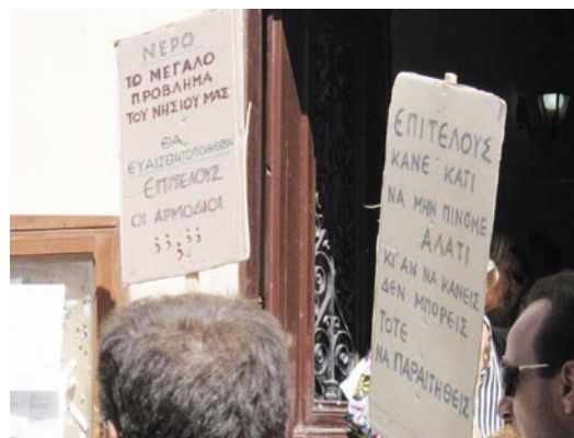
Σκηνές απόγνωσης εξαιτίας της έλλειψης νερού τον Αύγουστο 2005. Οι εκδηλώσεις αγανάκτησης ήρθαν και παρήλθαν. Το νερό ξανάτρεξε στη βρύση μας και αμέσως ξεχάσαμε το πρόβλημα, που όμως παραμένει και διογκώνεται και σύντομα – δυστυχώς – θα το ξαναβρούμε μπροστά μας.