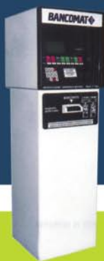
Αυτόματος πωλητής καυσίμων