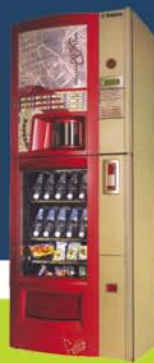
Αυτόματος πωλητής καφέ, αναψυκτικών & snacks